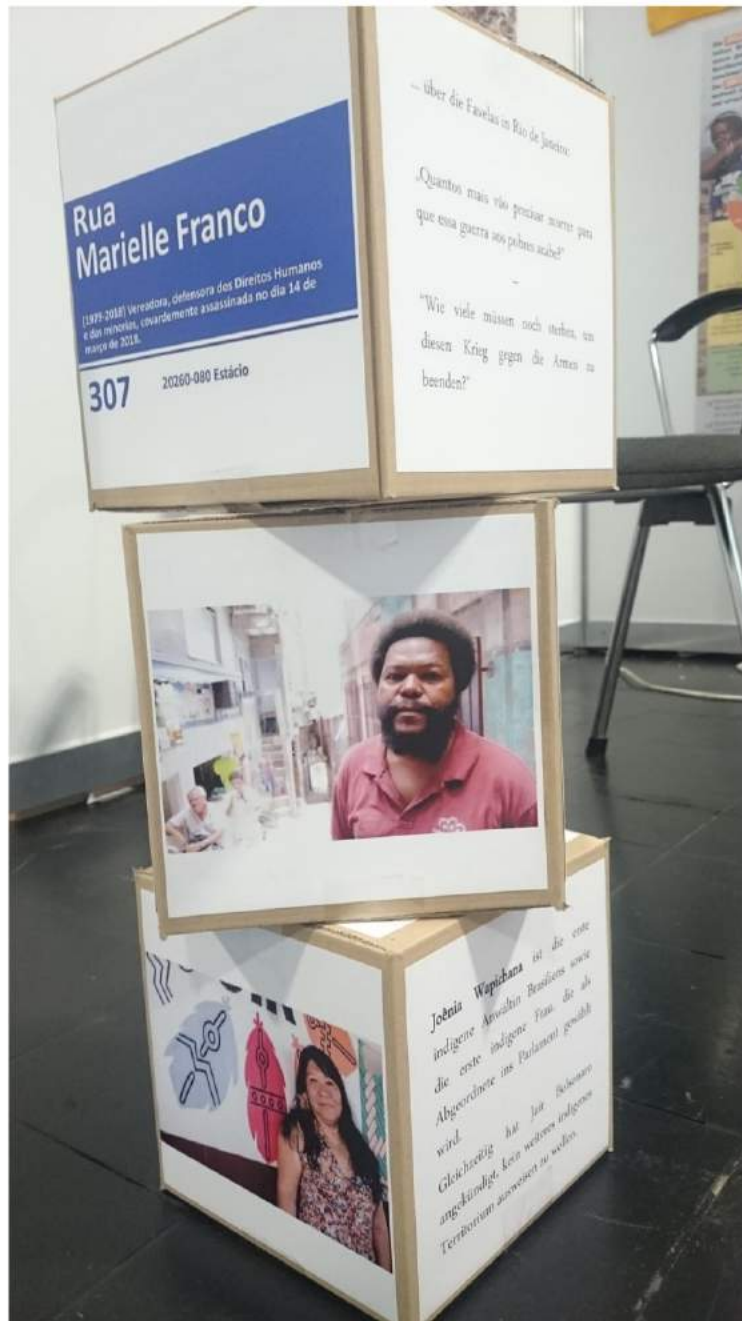
Kirchentag 2019 in Dortmund