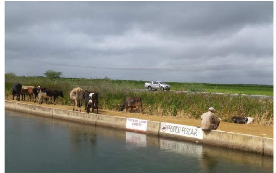
Eingeklemmt zwischen Bewässerungskanal und Bundesstraße. Ein Viehhirte in der Nähe von Juazeiro, Bahia

Vorraussichtlich im September wird sich Uta aus der Geschäftsstelle einen Eindruck vor Ort verschaffen können und die dort gewonnen Impressionen in den Runden Tisch, der 04.12. - 06.12.2020 in Bonn stattfindet, einfließen zu lassen.