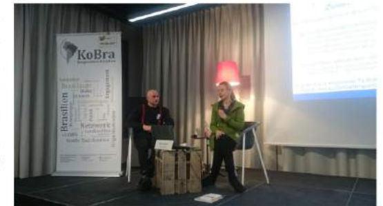
Auftaktveranstaltung bei der FJT in Frankfurt

Beliebter Bestandteil der entwicklungspolitischen Bildungsarbeit KoBras war im vergangenen Jahr erneut der bilinguale Podcast +1c@fé. Dieser wird bereits seit mehreren Jahren in Kooperation mit Radio Dreyeckland in Freiburg und Partnern in Brasilien produziert und hat sich als gefragtes Format etabliert. 2019 wurden neun weitere Ausgaben erstellt, unter anderen zu folgenden Themen: Zensur und Drohungen in den öffentlichen Medien; vaza jato – die Enthüllungen von The Intercept; die Lage der Indigenenrechte unter Präsident Bolsonaro; die Ölkatastrophe an Brasiliens Küste. Die vielen positiven Rückmeldungen und fortwährend hohe Abrufzahlen, lassen uns darauf schließen, dass sich der Podcast weiterhin großer Beliebtheit erfreut.