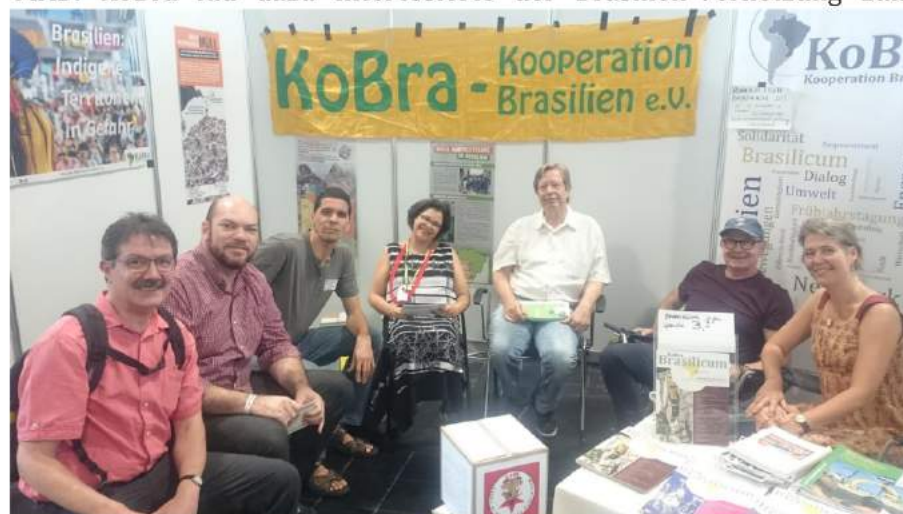
KoBra Infostand mit Mitgliedern, Interessierten, Gästen, Vorständen und Uta aus der Geschäftsstelle.

Besuch aus Brasilien erreichte uns im Jahresverlauf von der Landlosenbewegung MST und vom Bündnis der Staudambetroffenen MAB. KoBra lud dazu Interessierte der Brasilien-Vernetzung zum