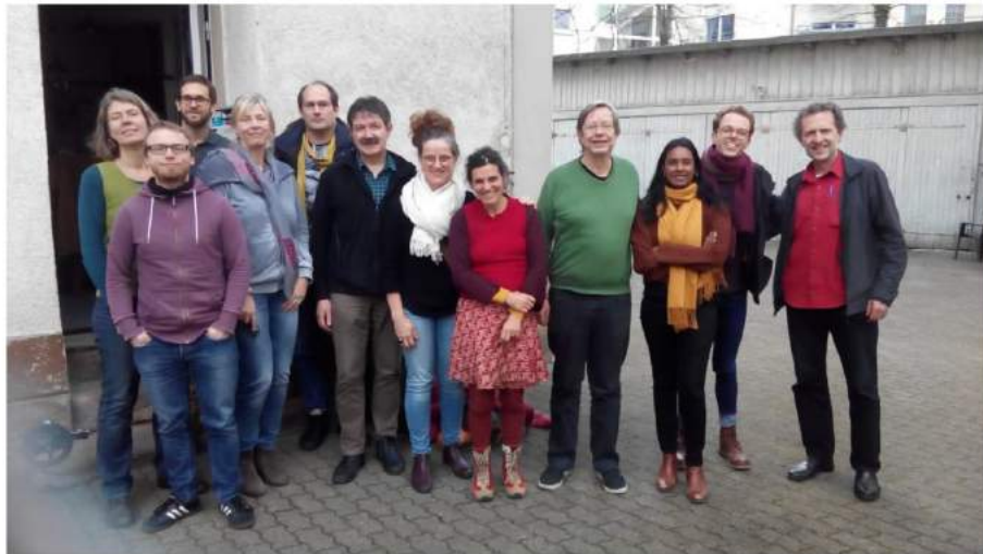
Planungstag des Runden Tisch Brasilien in Freiburg