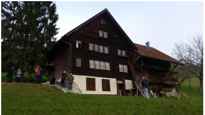
Klausurtagung in Altstätten, SG (CH), Januar 2018

der KoBra-Finanzierung sein werden. Der Vorstand traf sich zu einer Klausurtagung und zwei Vorstandssitzungen gemeinsam mit den Mitarbeiter*innen der Geschäftsstelle.