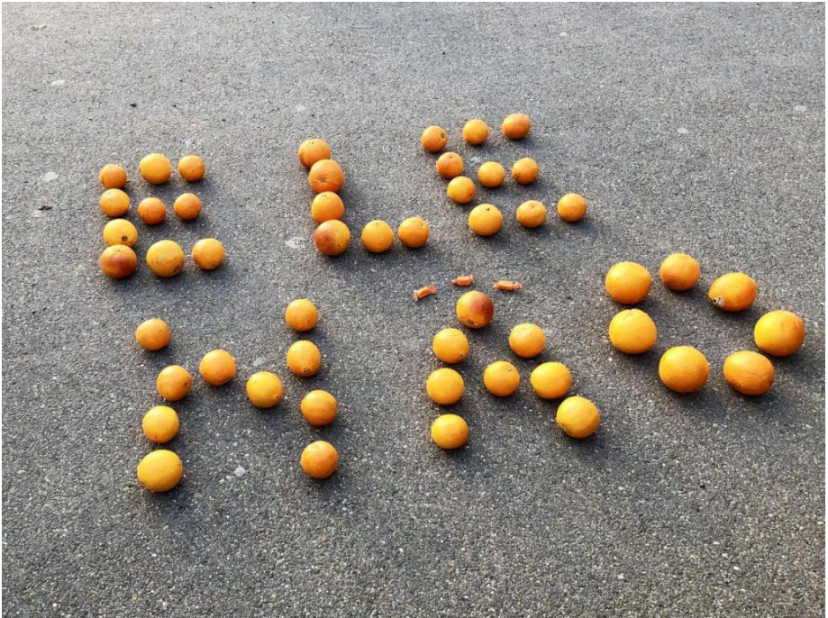
Proteste anlässlich des Bolsonaro-Besuchs in Davos (CH) Mitte Januar