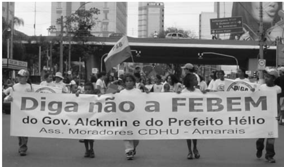
“Sag nein zur FEBEM” www.midiaindependente.org

Einige Länder lassen die individuelle psychologische Entwicklung als Kriterium zur Beurteilung von Gewalttaten jugendlicher zu, wobei davon die Altersgruppen von 14 bis 18 bzw. 12 bis 18 Jahren betroffen sind, die sich im Übergangsstadium zwischen Kindheit und Erwachsenenalter befinden. In dieser Altersgruppe wird beurteilt, ob der jeweilige Jugendliche für sein Verhalten verantwortlich gemacht werden kann, abhängig davon, ob er in der Lage ist, das Unrecht seiner Tat einzusehen. In Anbetracht dieser weltweit feststellbaren Tendenz sollte das Lebensaltermodell der brasilianischen Legislative überdacht, mit Augenmaß und Vorsicht neu debattiert und eine Übernahme des Kriteriums der individuellen Reife und Verantwortung in Betracht gezogen werden.