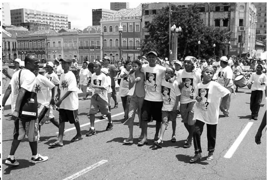
Grupo Ruas e Praças