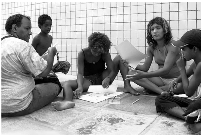
Grupo Ruas e Praças

arbeit des Staates darin, eine Minderheit der Bevölkerung vor den Konsequenzen zu schützen, die der Mangel an wirklicher Präventionsarbeit in Form von Jugendgewalt und -kriminalität zeitigte. Daher berücksichtigte die Präventionsarbeit nicht die wirklichen Bedürfnisse der ausgeschlossenen Bevölkerung. Die wenigen Mittel wurden in die Beseitigung der Sichtbarkeit und unmittelbaren Konsequenzen von Armut investiert, nicht aber in die Beseitigung von deren Ursachen. So wurden Freizeitprogramme für arme Jugendliche geschaffen, um diese sinnvoll zu beschäftigen. Eine Analyse oder gar Veränderung ihrer Armutsverhältnisse jedoch unterblieb.