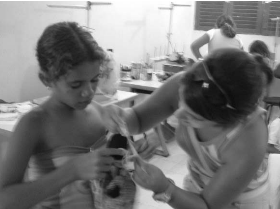
Aktion Weltweit Wichteln Evangelisches Missionswerk in Südwestdeutschland

die Lebensumstände der Familien in Betracht zieht.